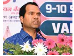
Shri Vikrant Vir, IPS