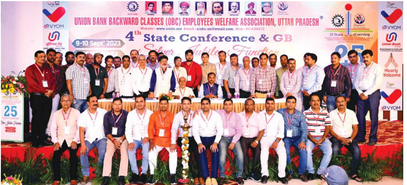
वर्ष 2023-2026 के लिए संगठन के नव निर्वाचित/मनोनित प्रतिनिधिगण