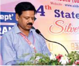
Shri Mulkraj Anand